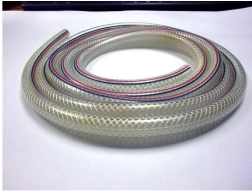
帆線 PVC 喉 (不能用)