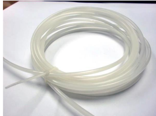
聚乙烯 PE 喉